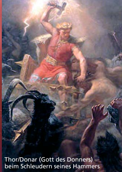
Thor/Donar (Gott des Donners) beim Schleudern seines Hammers

Diese Broschüre soll Ihnen zeigen, wie Sie den Gefahren eines Gewitters richtig begegnen und dabei weitere, wissenswerte Informationen rund um das Thema Blitz geben.