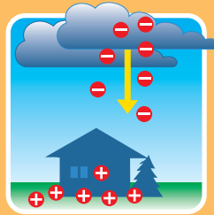
Entwicklung eines Leitblitzes

Ein Blitz ist nur wenige Zentimeter dick, aber jeder Meter leuchtet wie 1 Million 100 Watt-Glühlampen. Denn Blitze sind elektrisch geladen. Überraschend mag, dass ein Blitz, von unten nach oben verläuft! Sekundenbruchteile vor dem eigentlichen Blitz findet zwar eine Vorentladung von der Wolke zur Erde statt, diese ist aber für das Auge kaum wahrnehmbar.