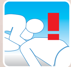
Mund-zu-Mund-Beatmung; dabei Kopf des Verletzten überstrecken

Mit überkreuzten Händen das Brustbein des Verletzten 30x etwa 5 cm tief eindrücken, dann 2x beatmen (30:2).