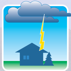
Hauptblitz von einer negativ geladenen Wolke ausgehend